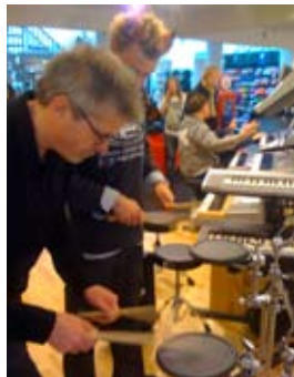
Det går fort hos Tre45.