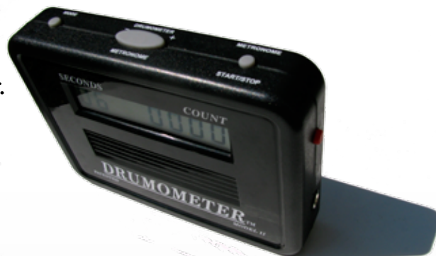
Drumometer - oppfunnet av Boo McAfee

Maskinen piper når tiden er ute. Resultatet ser du på skjermen. For moroskyld kan du multiplisere ditt resultat med 10. Klarer du å holde samme tempo i 60 sekunder?