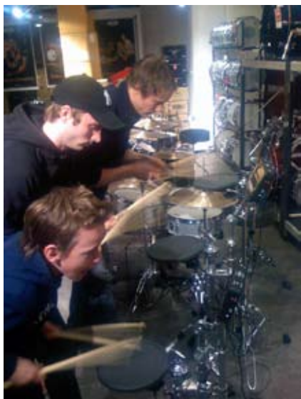
Solid innsats hos 4Sound Imerslund 2008.