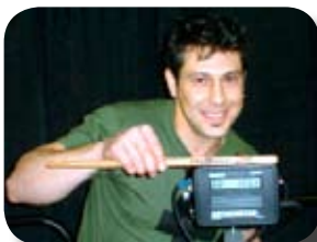
Mike Mangini - 1247 slag

Verdensrekorden holdes av slagverker Mike Mangini, og er på 1247 enkeltslag.